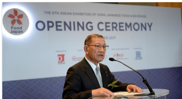
内閣総理大臣補佐官 衆議院議員 宮腰 光寛 氏による開会式挨拶