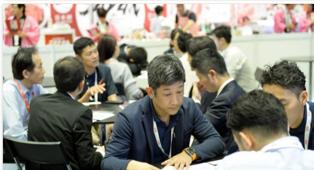
出展者との間で活発な商談が行われています