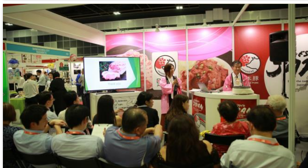
各種ワークショップが開催されています