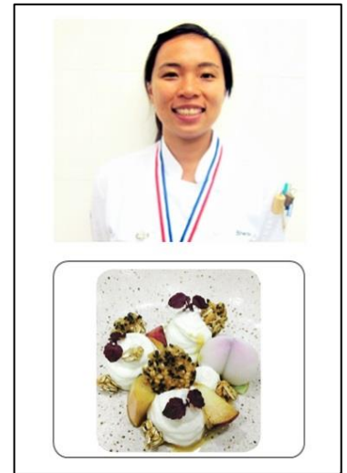
Soybean Parfait with Caramelized Peach, Red Bean Peach Mochi, Sesame Cracker and Granola

「J-Food Court」(特設会場: J-Food Court) を併設。新しい魅力を伝える新メニューを現地外食店舗、食品メーカーと連携し企画販売。“バクテー・ラーメン”や“日本産米×ハラル認証カレー”のカレーライス、現地人気カフェメニュー、ドリンク等、新しい日本の食の可能性を提案します。