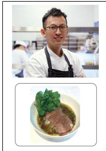
Warm Olive-Miso Broth, Udon/Soba, Thin Sliced Beef Rib & WaterCress