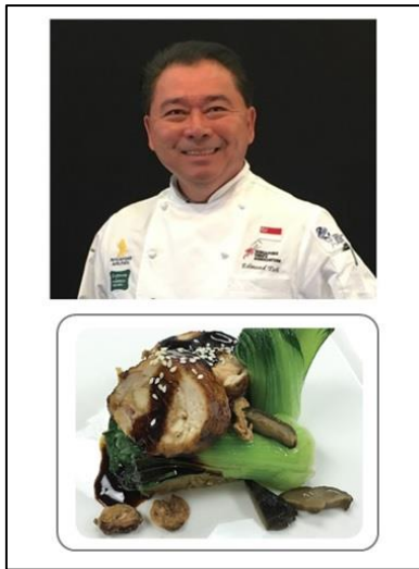
Lemongrass Glazed Chicken (Halal)